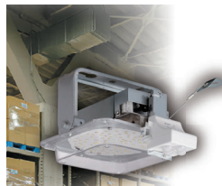
人感センサタイプ